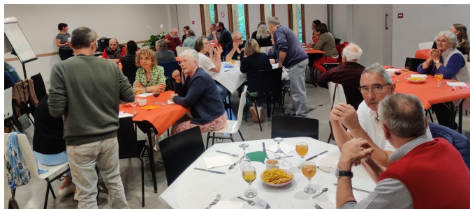
Chaque année, une soirée des bénévoles est organisée

...Ainsi chacun peut prendre la place qui lui convient.